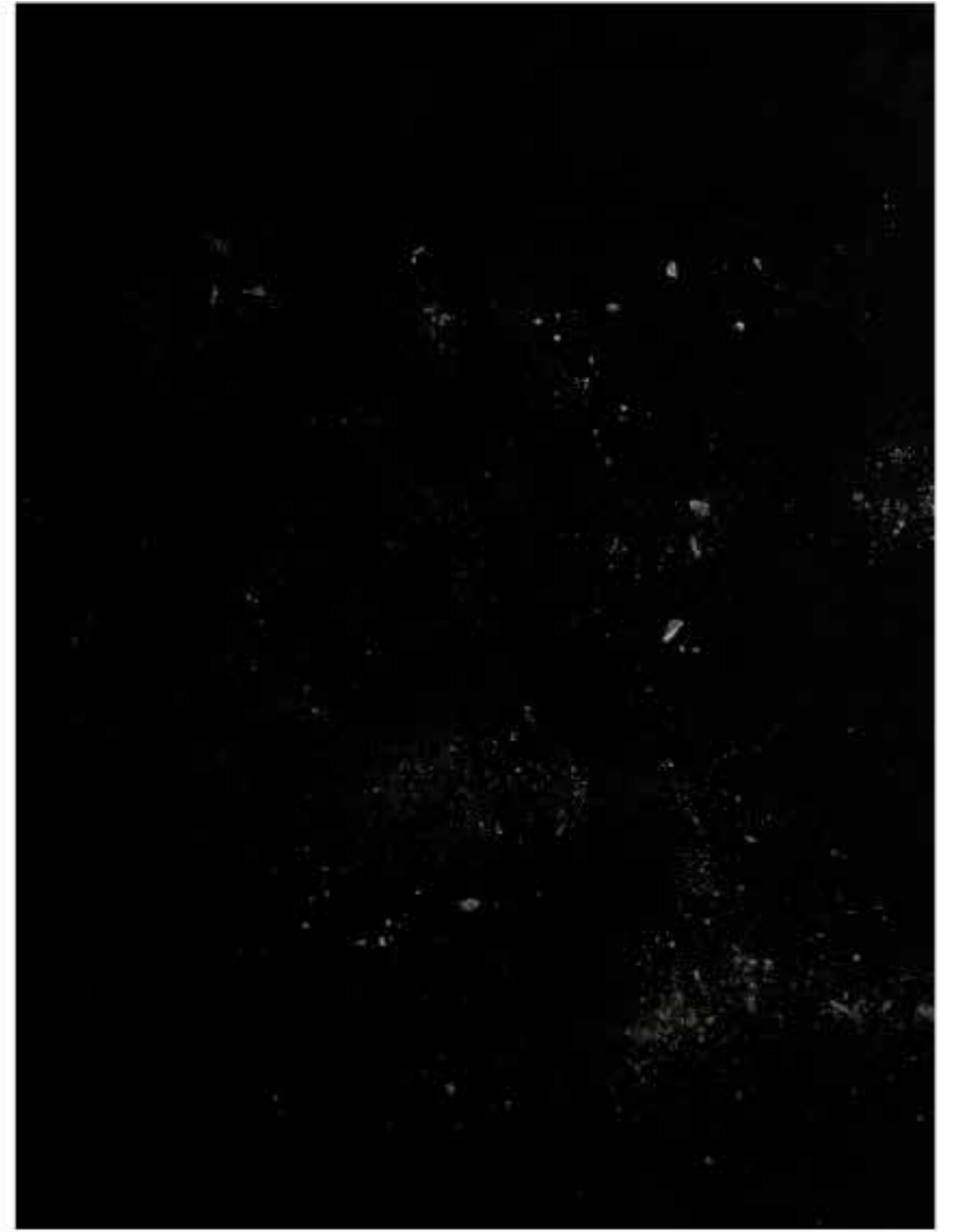
title Sequenza 4887 - year 2023 - medium giclée on cotton paper