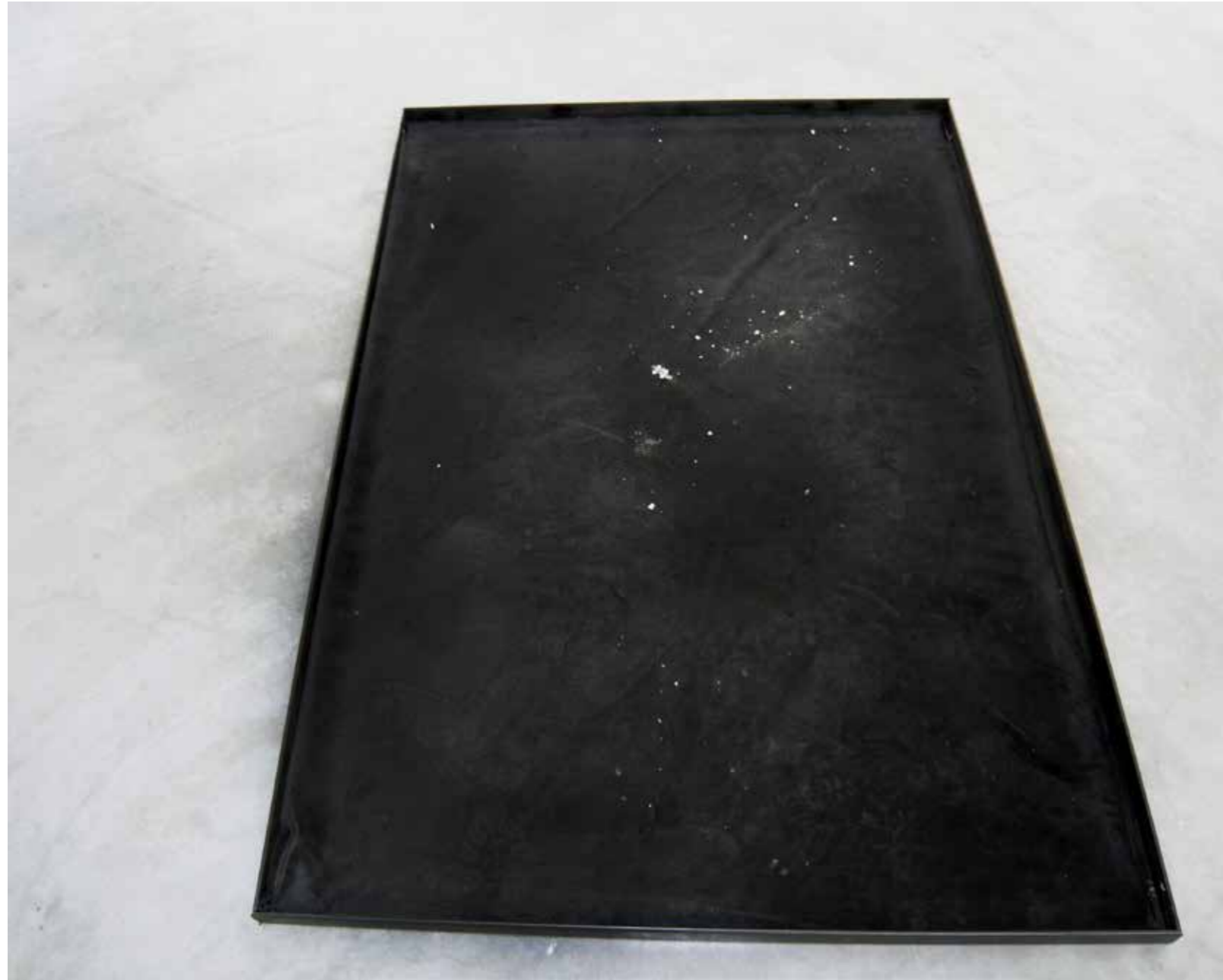
title Instalation - Black velvet sheet left a month on the floor of Cosmologie exhibition, year 2024