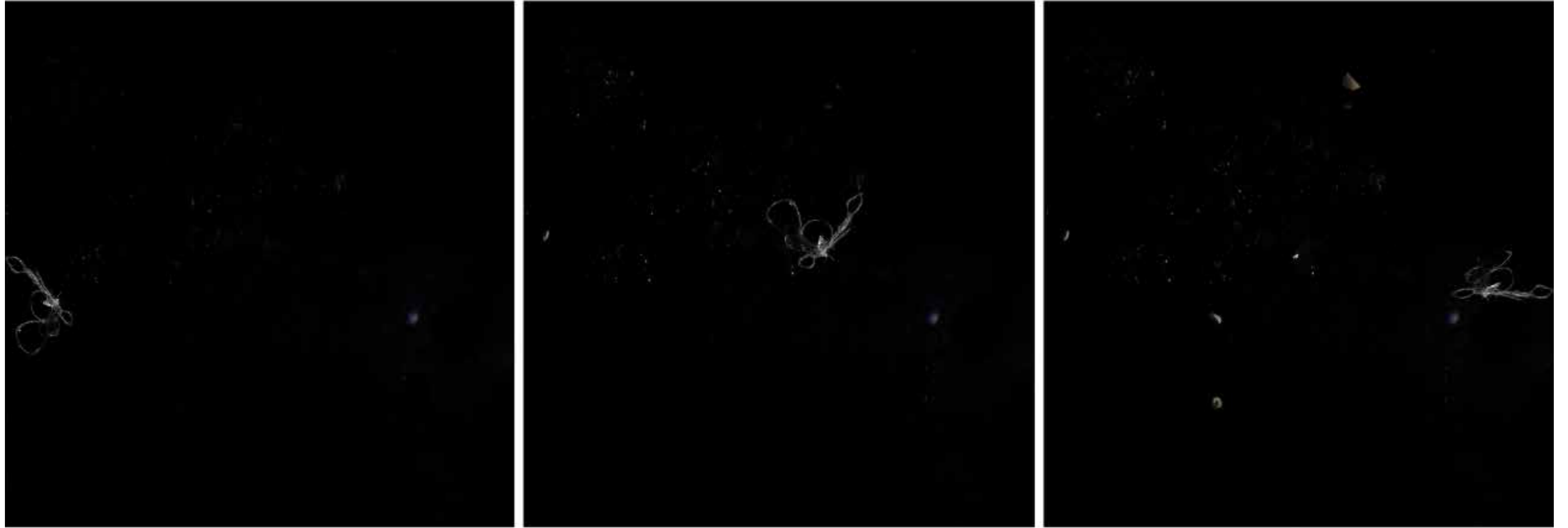
title Sequenza 4869 - year 2023 - medium giclée on cotton paper