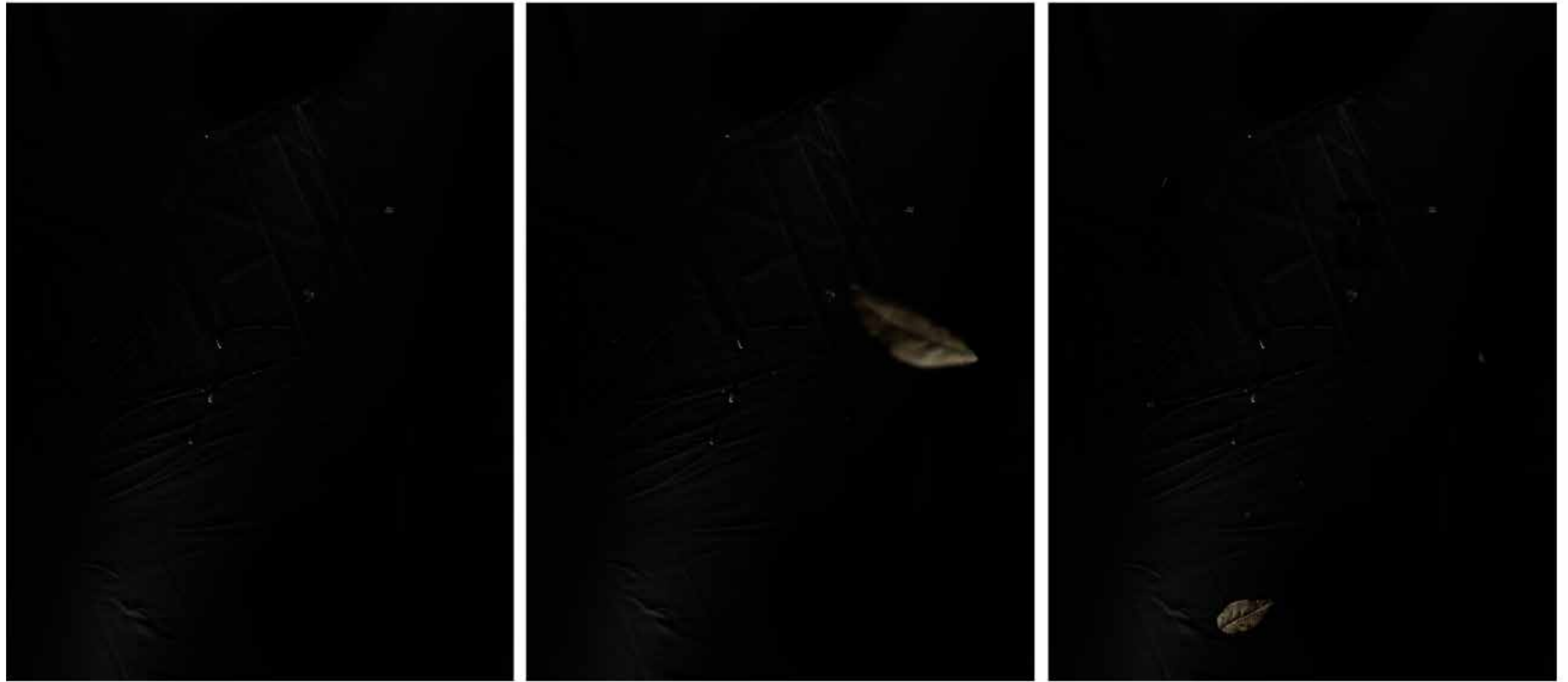
title Sequenza 4851 - year 2023 - medium giclée on cotton paper